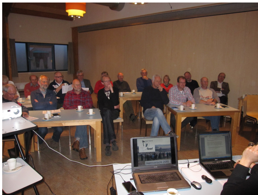
Jaarlijkse Algemene Ledenvergadering op 30 maart 2012

Zie over deze zaken ook het stukje over de 'digitale footprint van de VWG' van Hans Verdaat elders in dit verslag