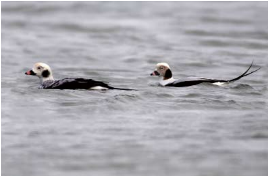
IJseenden Clangula hyemalis , Paal 33, 7 november 2008