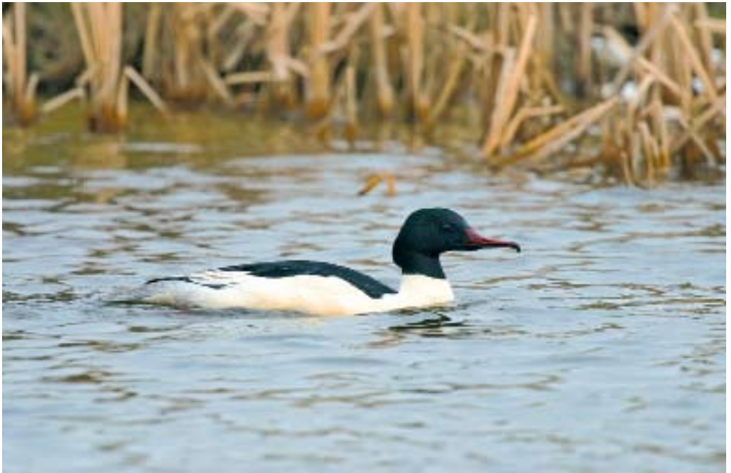
Grote Zaagbek Mergus merganser , Den Burg, 20 februari 2008 (Arend Wassink)