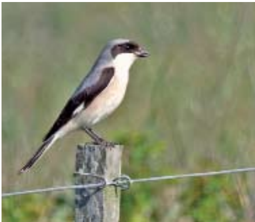
Kleine Klapekster Lanius minor , Grote Vlak, 8 juni 2008 (Arend Wassink)