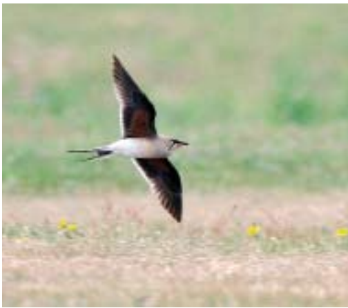
Vorkstaartplevier Glareola pratincola , Hoornder Nieuwland, 31 mei 2008 (Eckard Boot)