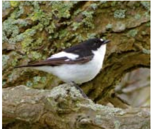
Bonte Vliegenvanger Ficedula hypoleuca , de Tuintjes, 29 april 2008, (Ed van der Es)