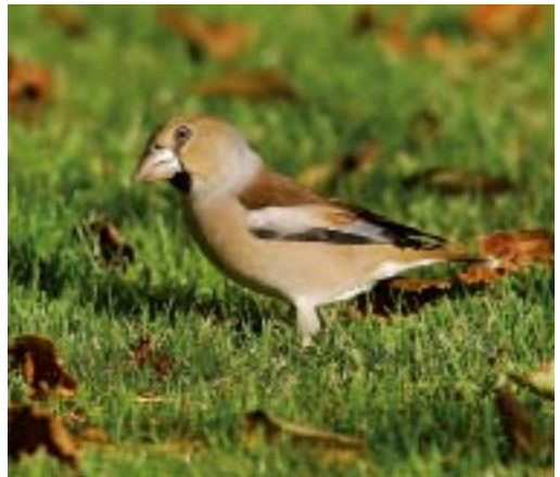
Appelvink Coccothraustes coccothraustes , De Cocksdoorp, 31 oktober 2008