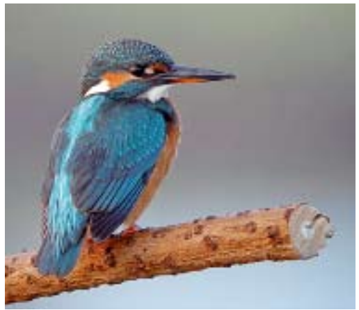
IJsvogel Alcedo atthis , 't Stoar, 28 september 2008 (Salko de Wolf)