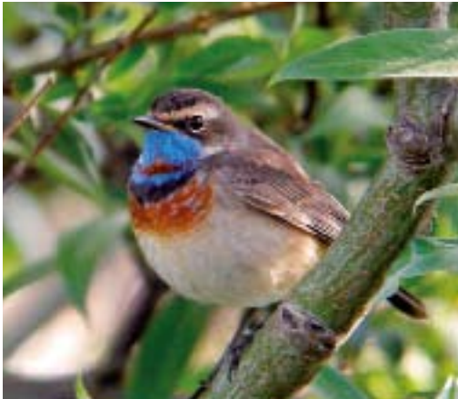
Roodsterblauwborst Luscinia s svecica , de Tuintjes, 18 mei 2008 (Klaas Ophoff)