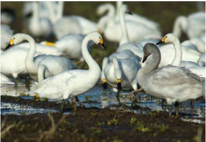
Kleine Zwaan Cygnus bewickii , ad en juv, Laagwaalderweg, 20 januari 2009

Wilde Zwaan Cygnus cygnus Er werden 16 waarnemingen ontvangen. In januari en februari werden regelmatig 2-5 ex gemeld. Daarna werd de soort pas weer op 26 oktober en 1 november gezien met resp 5 ex op de Bol en 7 ex in Dijkmanshuizen. In december werden regelmatig 1-3 ex gezien. De Wilde Zwaan is een schaarse soort op Texel met in de afgelopen 15 jaar nooit meer dan 20 pleisterende ex en slechts in 7 jaren lag het max boven de 10 ex.