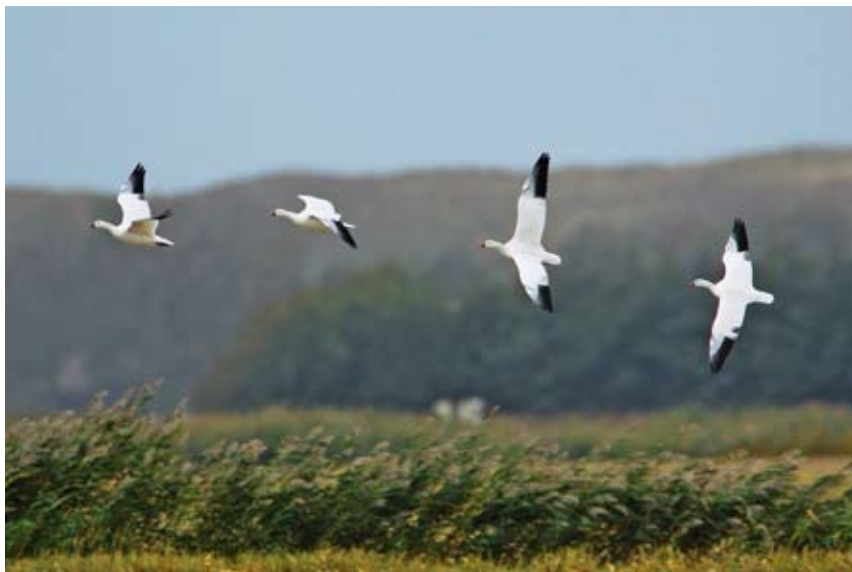
Ross' Gans Anser rossii , ad, Waal en Burg, 3 oktober 2009 (Eric Menkveld)

Ross' Gans Anser rossii Een groep van 4 ad ex werd op 24 september voor het eerst waargenomen bij de Westerkolk. De vogels werden voor het laatst gezien op 21 oktober in de Prins Hendrikpolder. In de tussenliggende periode werden ze op veel locaties gezien, zoals de Laagwaalderweg, polder het Noorden, zuidelijk Eierland, Hogezaandskil, Zeeburg en Dijkmanshuizen. Geen van de vogels was geringd of vertoonde andere kenmerken die zouden kunnen duiden op een herkomst uit gevangenschap. Het betrof een nieuwe soort voor Texel.