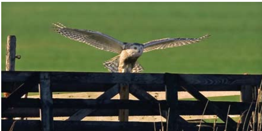
Sneeuwuil Bubo scandiacus , 2 e kj ♀, Zeeburg, 2 januari 2009 (Dirk Boon)

in de Staatsbossen 2 paren. In het cultuurland werd de soort niet als broedvogel vastgesteld. In totaal dus 3 paren tegen 5 in 2008 en dat was al een daljaar.