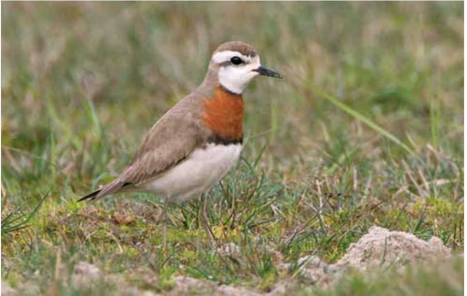
Kaspische Plevier Charadrius asiaticus , ad ♂, De Nederlanden, 28 april 2011 (René van Rossum)