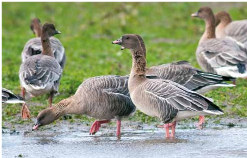
Kleine Rietgans Anser brachyrhynchus , De Cocksdorp, 6 december 2011

september weer 6 en in oktober 2 en 3 ex. Vanaf 6 november werd de soort weer regelmatig gezien met als max 32 ex in de Prins Hendrikpolder op 26 november en 60 ex in polder Eierland op 2 december.