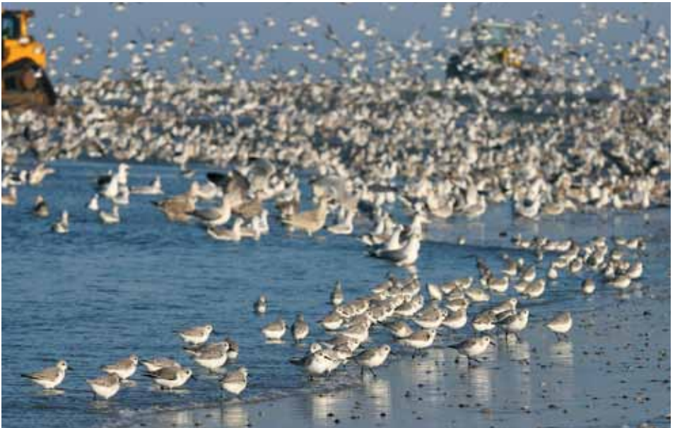
Zandsuppletie op het Noordzeestrand thv paal 13 , 13 november 2011 (Piet Druif)