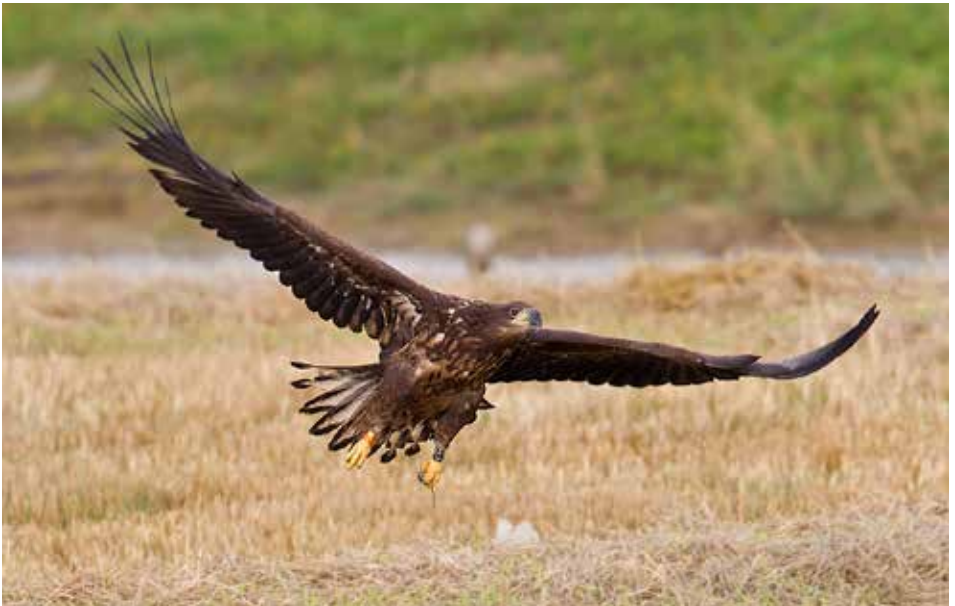
Zeearend Haliaeetus albicilla , 1kj, polder Het Noorden, 29 augustus 2014