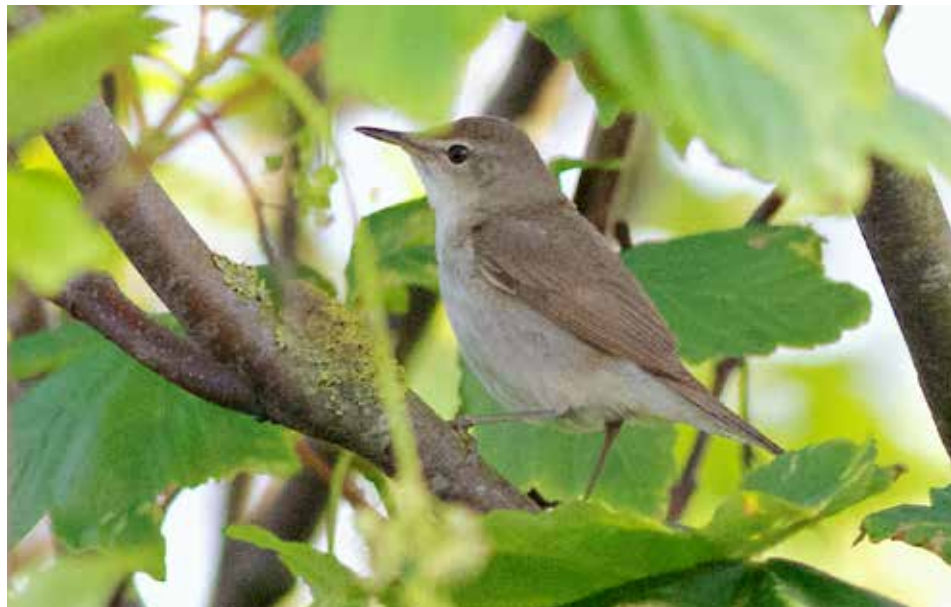
Struikrietzanger Acrocephalus dumetorum , ♂, De Tuintjes, 24 mei 2014

Struikrietzanger Acrocephalus dumetorum Heel bijzonder waren de waarnemingen van maar liefst 3 zingende vogels in het voorjaar, resp op 24 mei in De Tuintjes, op 25 mei in de Eierlandse duinen en op 6-7 juni bij het Reddingboothuis. Er zijn nu 6 waarnemingen voor Texel bekend.