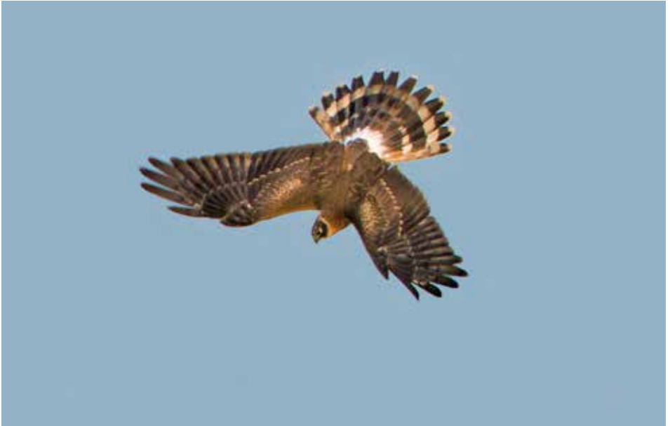
Steppekiekendief Circus macrourus , 1kj ♂, Eierland, 11 oktober 2014 (Karel Mauer)