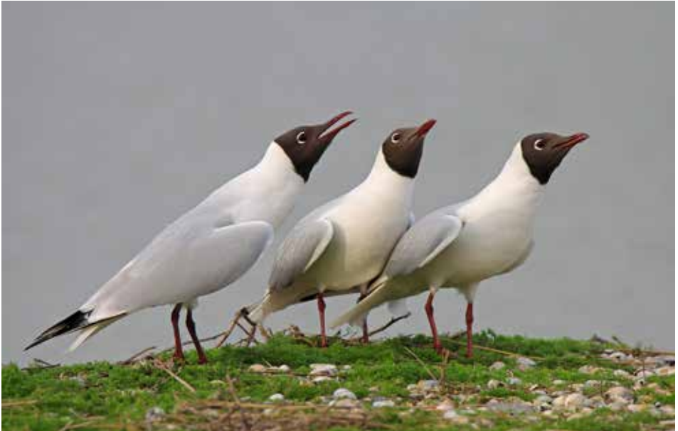
Kokmeeuwen Chroicocephalus ridibundus , ad, Wagejot, 30 maart 2014

paal 20. Gedurende het hele najaar kwamen er meldingen binnen van Drieteenmeeuwen voor de kust met een max van 165 ex op 20 oktober bij paal 20 en met een kleine piek half december met een uurtotaal van 334 ex op 14 december bij paal 9.