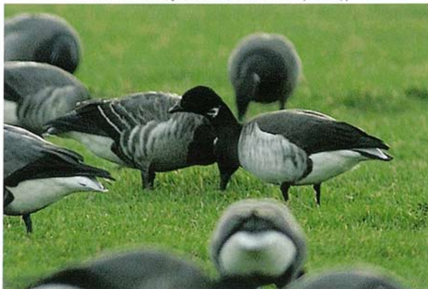
Witbuikrotgans Branta hrota, ad ♂ en hybride Witbuikrotgans x Zwartbuikrotgans B hrota x B bernicla, juv, Ottersaat, december 2003