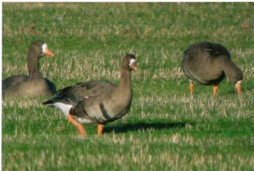
Groenlandse Kolganzen Anser albifrons flavirostris, ad (twee achterste vogels), Westerkolk, 7 december 2003