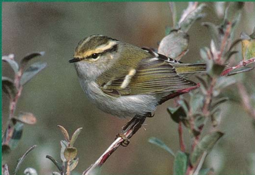
Pallas' Boszanger Phylloscopus proregulus , 1kj, de Tuintjes, oktober 2003 (Eric Koops)