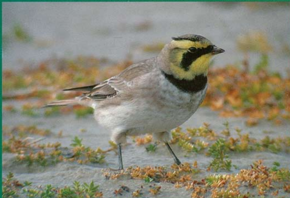
Strandleeuwerik Eremophila alpestris , de Slufter, oktober 2003 (Sjaak Schilperoort)