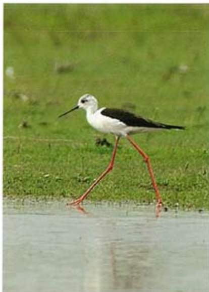
Steltkluut Himantopus himantopus , Waalenburg, 13 mei 2006