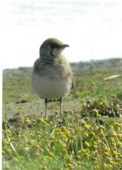
Vorkstaartplevier Gareola pratincola , Waalenburg, 3 juli 2006