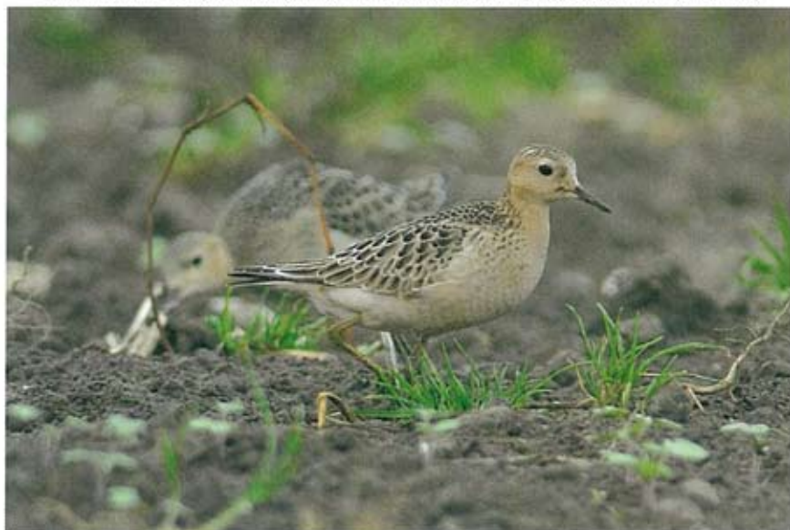
Blonde Ruiters Tryngites subruficollis , Prins Hendrikpolder, 25 september 2006 (René Pop)