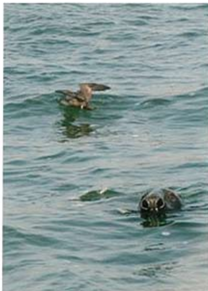
Vale Pijlstormvogel Puffinus mauretanicus , en Grijze Zeehond Halichoerus grypus , Noordzee, 23 juli 2006