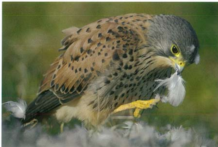
Torenvalk Falco tinnunculus , Ottersaat, 13 maart 2006 (René Pop)