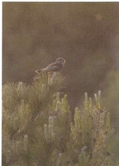
Nachtzwaluw Caprimulgus europaeus , Duinpark, 9 juni 2006 (René Pop)